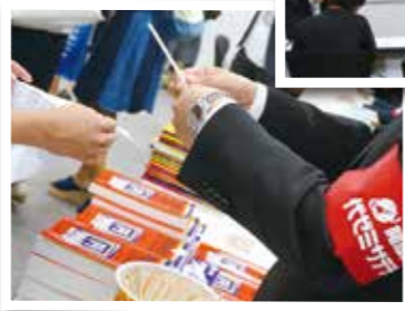
キミも景品抽選会に参加して赤本ゲット!