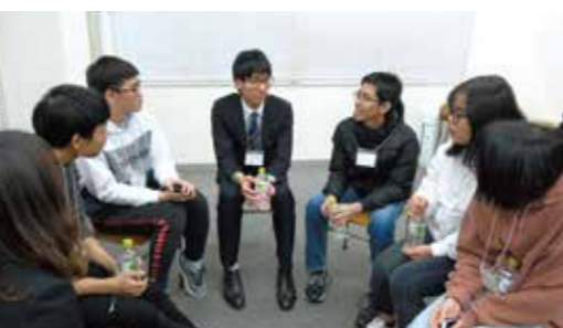
講師の話真剣なまなざしで聞く留学生たち。睡眠時間を削った受験勉強時の学習時間に留学生から『それは体に良くない』と言われる場面も...