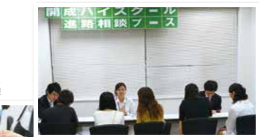
実際に大学に通う講師からの話は、生徒たちのモチベーションアップにつながります。

その他、大学の過去問題集(赤本)やQuoカードなどが当たる抽選会も実施しています。ぜひご参加ください。