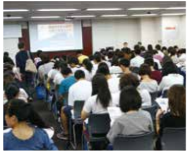
代ゼミの講師の講演と並び人気の「フリーステップ教育技術研究所の講演」。

こちらは産近甲龍4大学の英語の入試問題傾向と、その特徴・解答方法について説明を行います。これらの大学は公募推薦入試と一般入試がありますが、一般入試を中心にお話させていただきます。