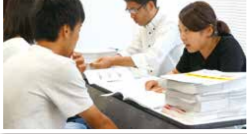
個別相談ブースの様子。各大学担当者のお話を真剣に聞いています。