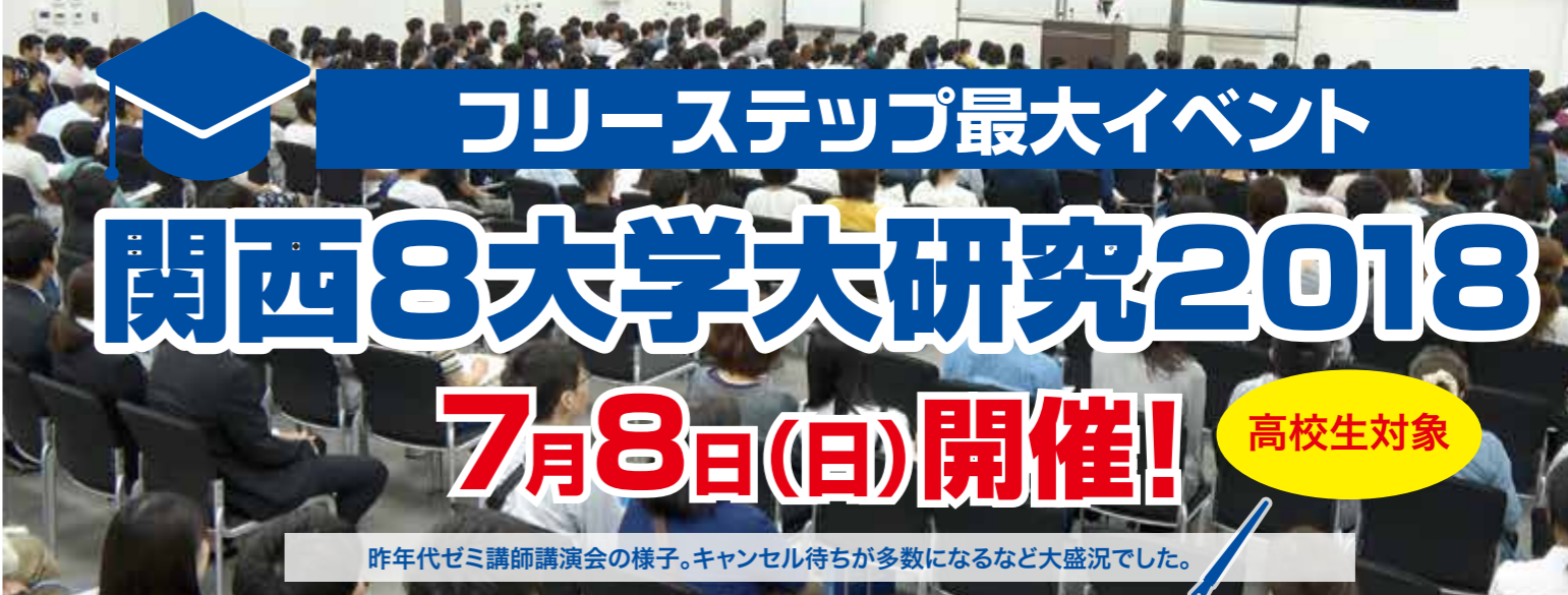
昨年代ゼミ講師講演会の様子。キャンセル待ちが多数になるなど大盛況でした。

今年もこの季節がやってきます。7月8日、開成教育グループ主催による、「関西8大学大研究」を実施いたします。