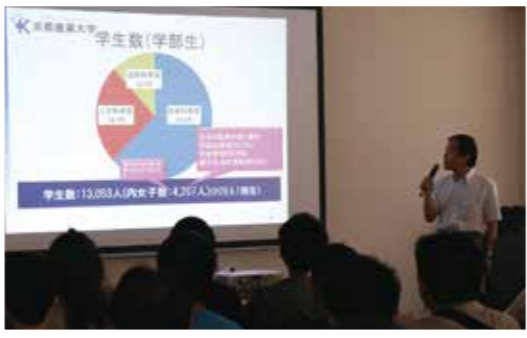
最新の入試情報や卒業後の進路、大学生活を送るキャンパスのことなど、大学の入試担当者ならではの情報を得ることができます。

個別相談コーナーでは、大学の入試広報の担当者特定の学部の教育内容やAO入試など、一斉の説明では聞くことができない内容をお聞きいただくことができます。大学によっては現役大学生をブースに同席させているところもありますので学生ならではの生の情報を聞いてみてはいかがでしょうか。