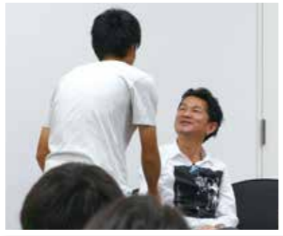
昨年講演後の様子。さすが代ゼミのカリスマ講師。次々に参加者が握手やサインを求めて集まります。