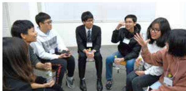
最初は講師も留学生もお互いになんか探りあいでしたが、すぐに打ち解け、終始和やかな雰囲気です。講師の学生の心をつかむコミュニケーション力はさすがです。

期末テストが近づくと時期、日本語学校の先生たちは学生たちがしっかり勉強してくれるか、成績が大丈夫か心配です。そんな中、普段フリーステップの教室で生徒の勉強を指導している講師の先生に、 ● 期末テストに向けてどんな勉強をすればよいのか？ ● 同じ語学を学んでいる先輩としてどうやれば効率よく学習できるか などを伝えてもらうことで、日本語学校に通う学生たちに頑張ってもらおうという目的のもと、座談会を実施しました。またフリーステップの講師には、違う文化を持つ学生たちとの交流や学習指導を通じて、指導の幅を広げてもらう目的もありました。