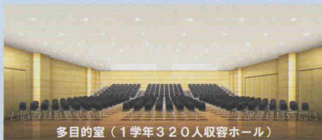
多目的室(1学年320人収容ホール)