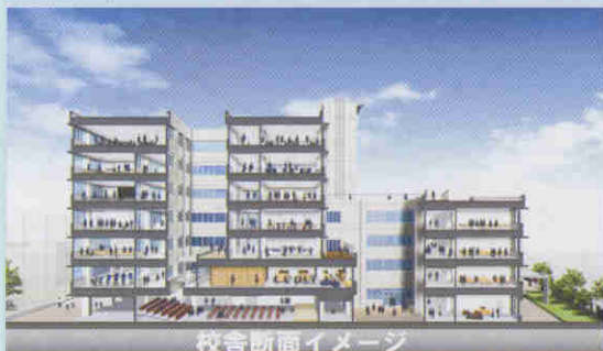
校舎断面イメージ