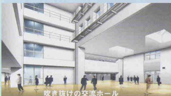
吹き抜けの交流ホール